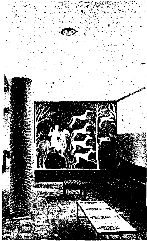
Detalle de la sala de estar de la residencia universitaria "Aralar", donde los alumnos reciben un indispensable suplemento a su formación.