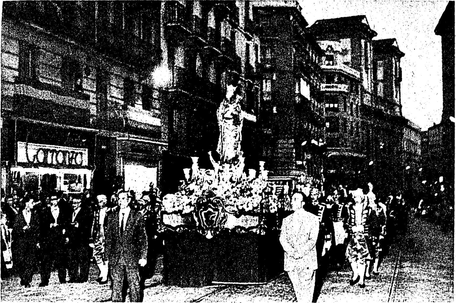
LA PATRONA, EN LAS CALLES DE MADRID. —La imagen de Nuestra Señora de la Almudena, Patrona de Madrid, a su paso por la calle de Toledo, durante la solemne procesión, celebrada con motivo de su festividad, y que presidieron las autoridades madrileñas.