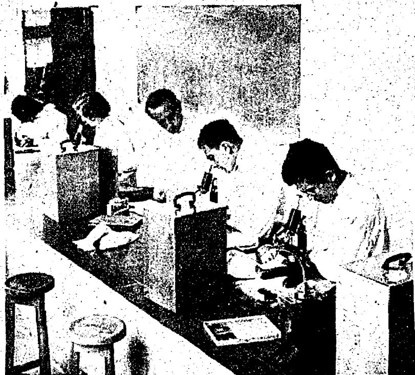
Un momento de las clases de biología en el curso selectivo de ciencias e Ingeniería.