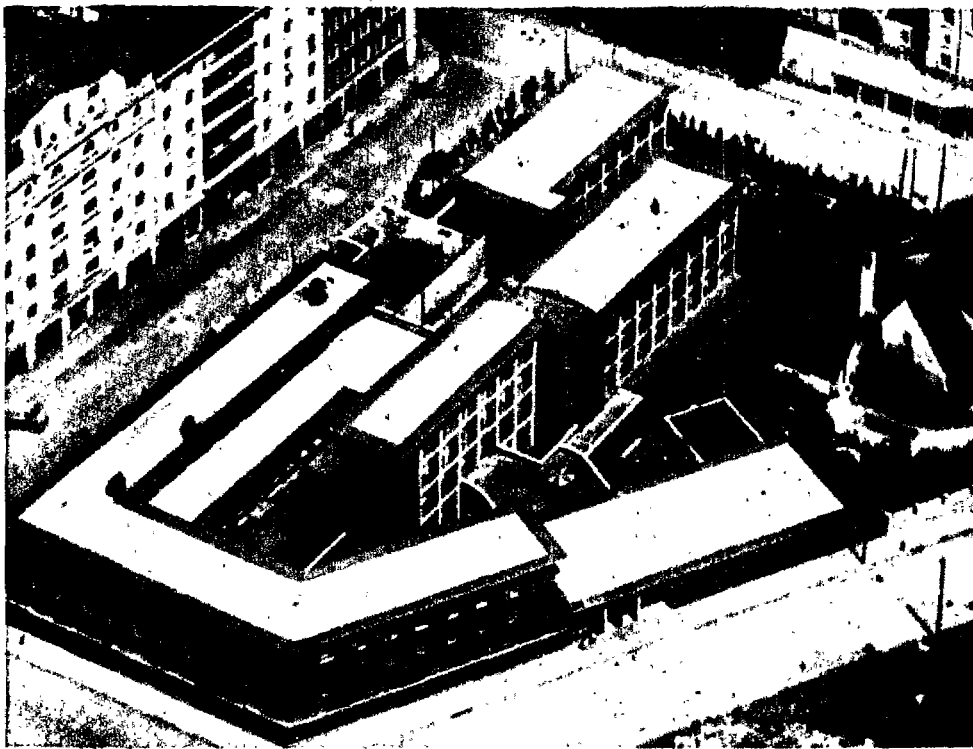
Vista aérea del Colegio Mayor Aralar, construido de nueva planta en el ensanche de Pamplona. Alberga en la actualidad cien estudiantes de diferentes nacionalidades, que cursan sus estudios en las Facultades e Institutos del Estudio General de Navarra.