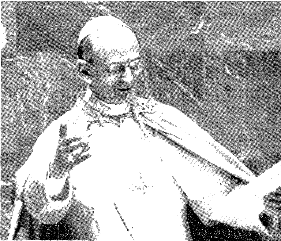
PABLO VI: CLEMENCIA.