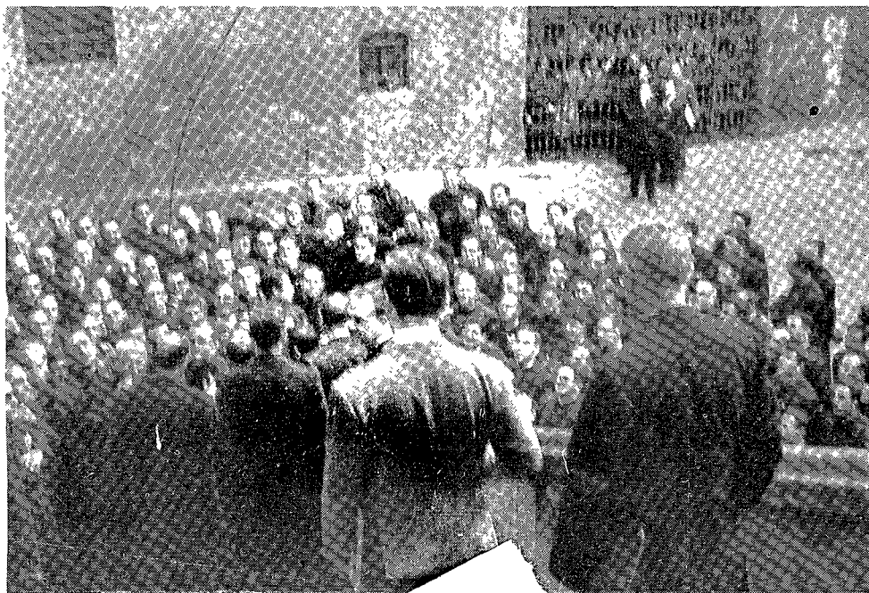
1966. EL CLERO SE MANIFIESTA