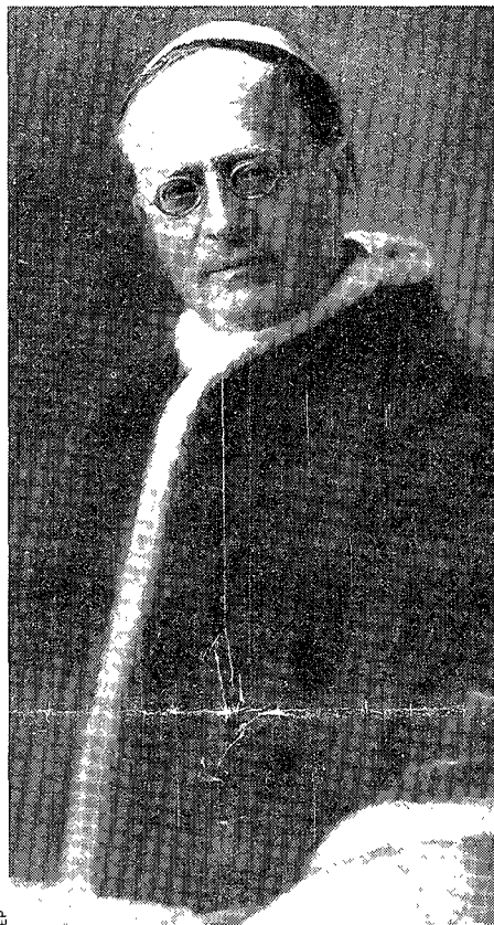
PIO XI: BENDICIONES A FRANCO

El documento habría sido impulsado por el cardenal Gomá tras una conversación mantenida con el general Franco en mayo de 1937. Al parecer, Franco se lamentó de la campaña injusta que se hacía en el extranjero contra España, aun en los medios ca-