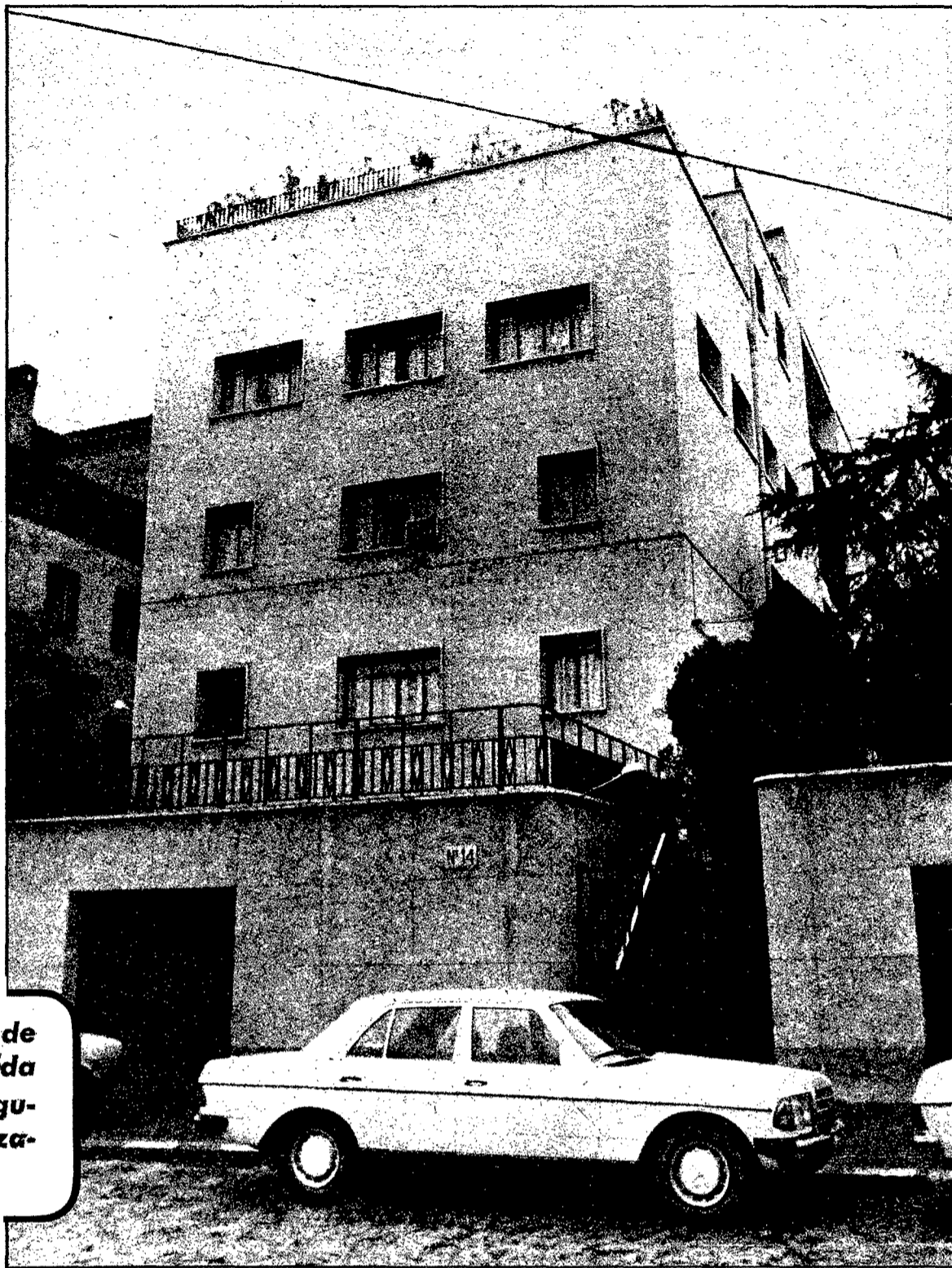
Chalé de la Delegación Comercial Soviética, situado en la calle Matías Montero, 14. Probablemente será la Embajada provisional de este país