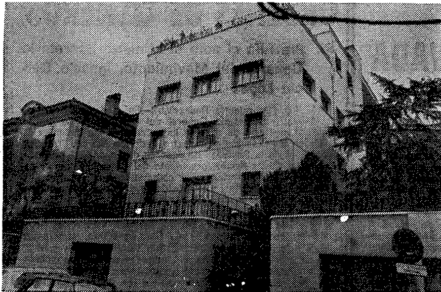
Edificio donde será instalada la Embajada de la Unión Soviética, en Madrid, en la calle de Matías Montero, 14.