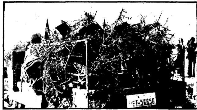
Misiles antiáereos "camuflados".

La hora de retraso entre el Sahara y España hacía clamar frecuentemente al taquígrafo que tomaba mis crónicas, así que preferí escribir la de aquel día sin quitarme antes la arena.