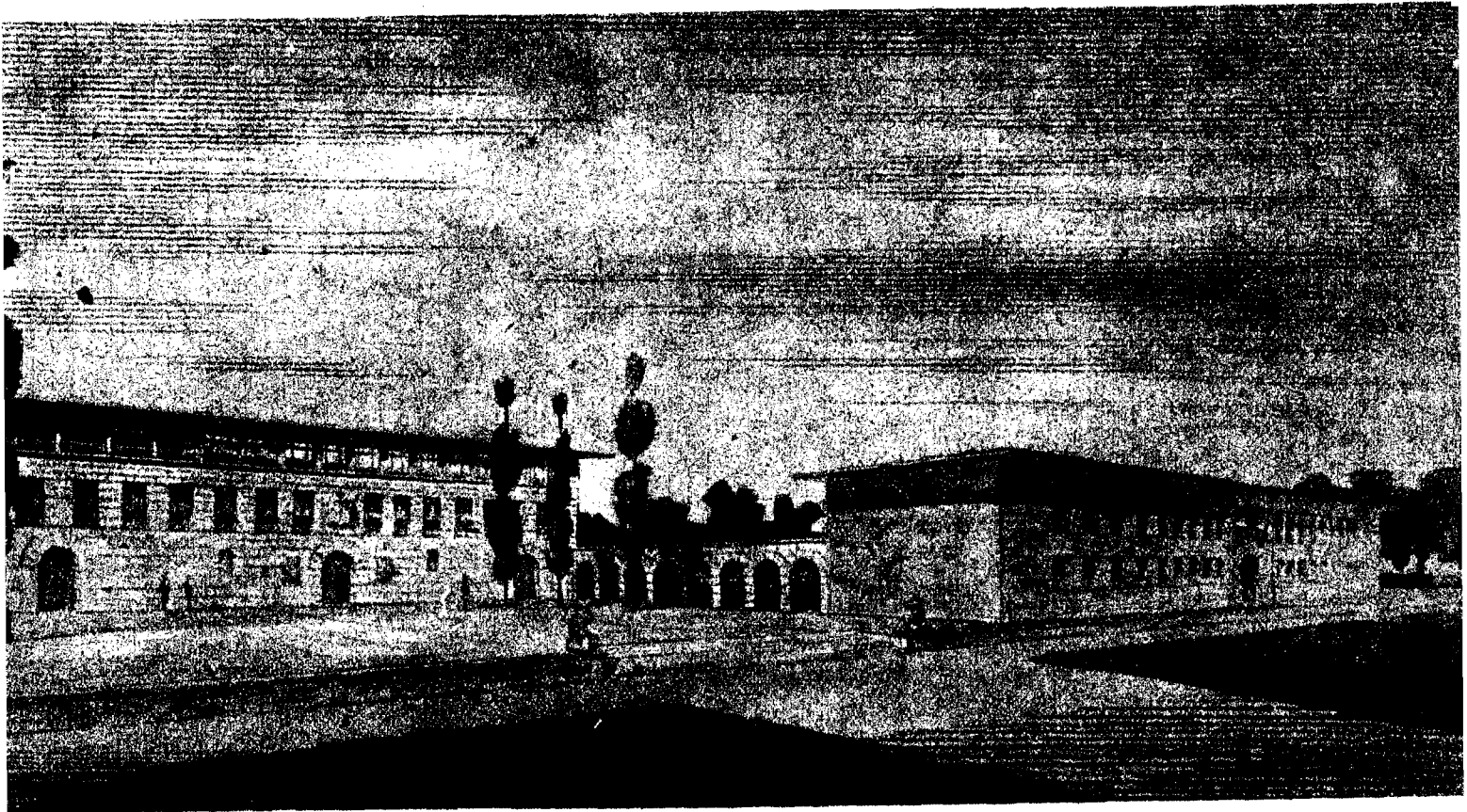
Facultad de Derecho y biblioteca—en construcción—de la futura Ciudad Universitaria de Pamplona.