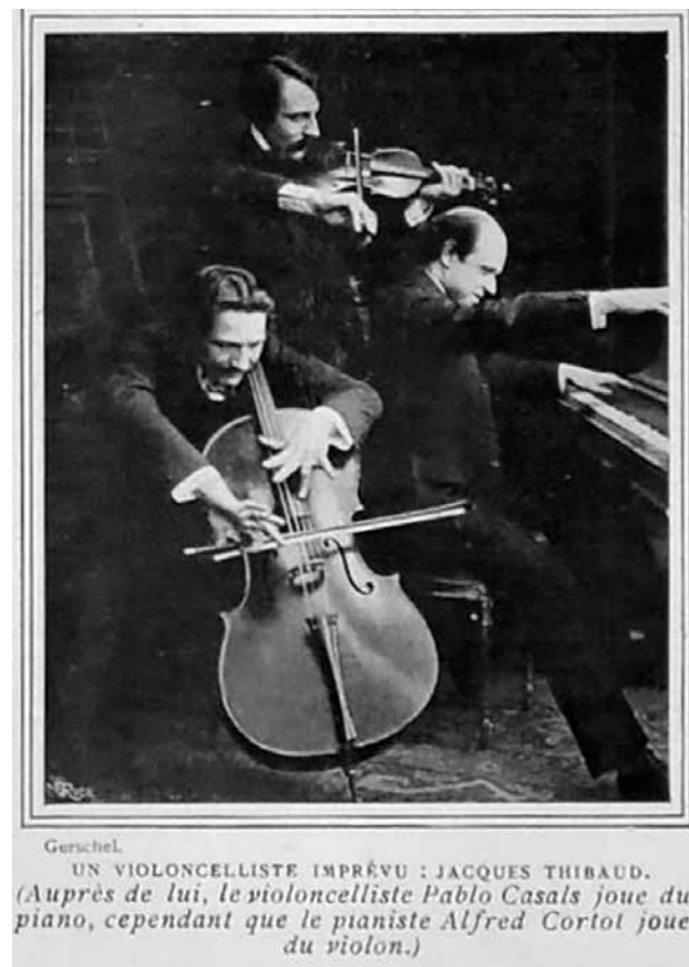
Alfred Cortot (al violín), Jacques Thibaud (al violonchelo) y Pablo Casals (al piano). Fotografía publicada en Musica en marzo de 1910.

La emancipación definitiva de la sonata a tres se lograría primordialmente a través de la separación de la línea del violonchelo con respecto a la mano izquierda del piano y con la capacidad de los dos instrumentos de cuerda para proporcionar material melódico y temático dentro de la forma sonata y en la secuencia de cuatro movimientos. Fue gestándose de este modo un nuevo formato lleno de posibilidades, cultivado inicialmente en los salones privados como Hausmusik y capaz de generar una expectación sin parangón en el público vienés hacia el cambio de siglo. Da fe