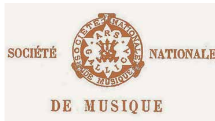
Logotipo de la Société Nationale de Musique, 1871. Escaneo de una impresión de autor desconocido.

En este contexto, no es de extrañar que aumentara rápidamente la demanda de composiciones para trío con piano, especialmente por parte de músicos profesionales. En otro centro neurálgico de la actividad musical de la época, Leipzig, un maduro Felix Mendelssohn (1809-1847) escribió un primer trío que se integró en el repertorio de forma casi inmediata; en este ciclo lo escucharemos en el tercer concierto. No hay que olvidar que Leipzig vio nacer una de las editoriales musicales más importantes y longevas, Breitkopf und Härtel, que tendría un papel decisivo en la difusión de la música instrumental, “absoluta”, en la que se encuadra la música de cámara