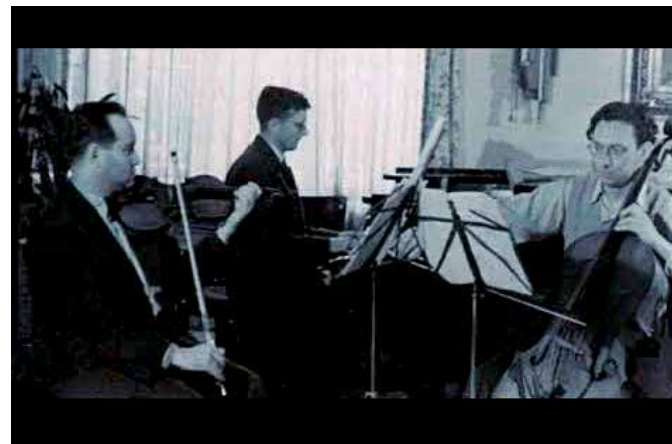
David Oistrakh, Dmitri Shostakovich y Miloš Sádlo durante un ensayo del Trío con piano n.º 2 en Mi menor en casa de Sádlo en Praga, 22 de mayo de 1947.

El lirismo de la obra se expresa con mayor claridad en el segundo movimiento. El primer tema, Lento , de carácter cuasi religioso y reminiscencias brahmsianas, es presentado por la cuerda sobre un característico acompañamiento homofónico en el piano. La sección central, Poco più mosso , está construida sobre un ritmo de siciliana acompañado por amplios arpeggios en el piano. El tercer movimiento, Allegro energico y Marcatisimo , exagera el virtuosismo de los tres instrumentos con arpeggios, figuraciones rápidas y juegos de articulación y timbre. Nos conduce, frenética e inexorablemente, a la cadencia más clara y conclusiva de todo el trío en una suerte de