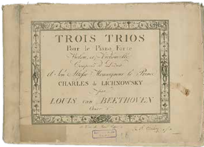
Portada de la primera edición de los Tríos op. 1 de Ludwig van Beethoven. Viena, Jean [Giovanni] Cappi para Artaria, 1895. Beethoven-Archiv, Bonn.