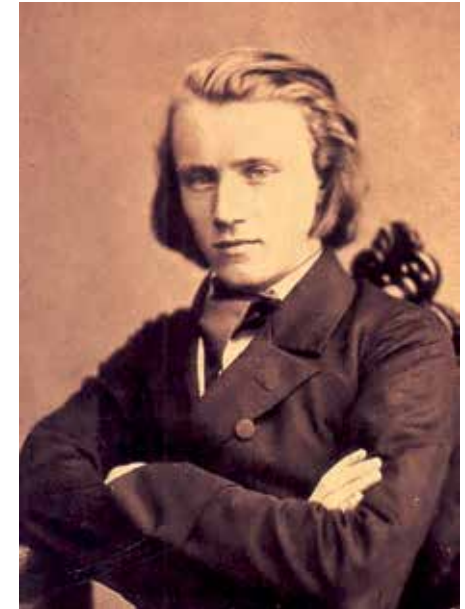
Johannes Brahms hacia 1855. Fotografía tomada en la casa de los Schumann en Zwickau.