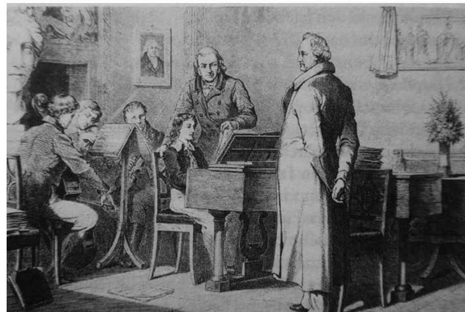
Johann Wolfgang von Goethe con Felix Mendelssohn y otros músicos en la casa del poeta en Weimar, 1821.

En este Trío n° 4, Dvořák va un paso más allá y, en vez de emplear moldes formales tradicionales, permite que cada uno de los seis movimientos desarrolle la estructura de la dumka sin obstáculos. Estilizándola, la convierte en una forma instrumental episódica con cambios bruscos de tempo y de carácter. Aun así, los diversos movimientos no son piezas aisladas, sino que están concebidos como un todo coherente. Así lo refleja la indicación attacca subito –o la numeración continua de los compases, según la edición– al final de los dos primeros, así como las cuidadas relaciones motivicas y la cohesión entre tonalidades cercanas –en ocasiones a través del contraste modal– a lo largo de los movimientos y también entre ellos. De este modo, las tres primeras dumkas del trío ocupan el lugar de un gran primer movimiento, tradicionalmente en forma sonata; la cuarta se corresponde con el movimiento lento del conjunto; la quinta presenta un carácter de scherzo, en 6/8; y el Finale cierra la obra a modo de rondó. Desde el comienzo, la voz del violonchelo se alza como idónea para expresar la tristeza,